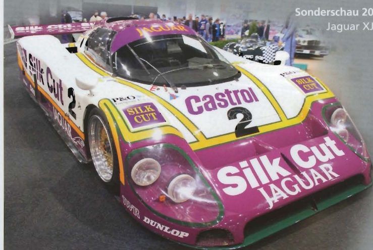
Sonderschau 2014: Jaguar XJ-R9

The hot-selling trade fair on the annual final The trend for collectors' automobiles from all eras is unbroken. The perfect combination of passion and safe investment attracts more and more people in their spell. Therefore make use of the historical Classic & Prestige Salon of the Essen Motor Show as first-class sales platform for the international marketing of your collectors' automobiles and all belonging to this, as model cars, services, literature, accessories, tools, art, automobilia, clubs, etc. We look forward to your participation!